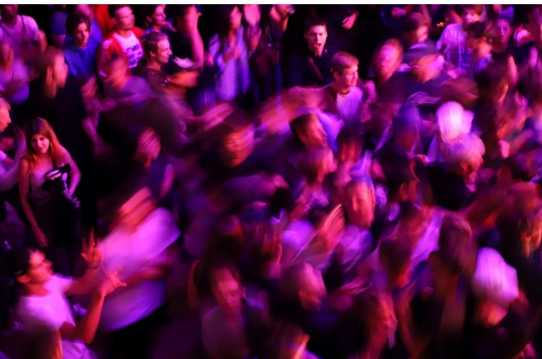
© Régine Gapany, 2019 | Expo OG